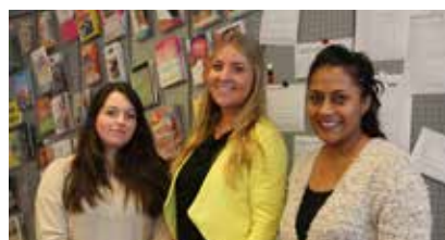
pag 11 > JIP neemt jongeren serieus