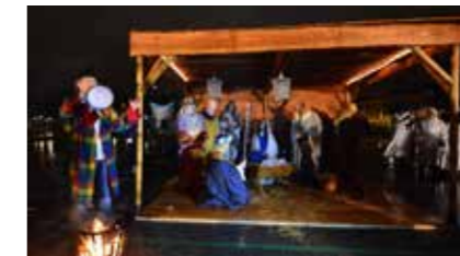
Kerstspel vanuit de Evangelisch-Lutherse Gemeente.

Leer hoe de naaimachine werkt, patronen tekenen en zelf je eigen kledingstuk naaien. € 35,- voor 10 lessen. 070-2052220