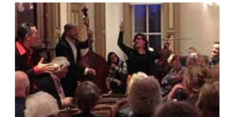
Gipsy concert met ensemble Sintiomarus.