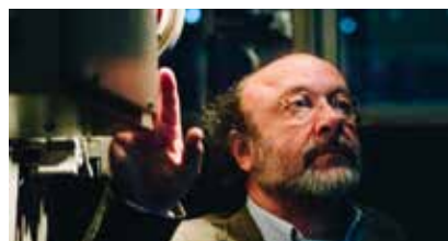
pag 06 > Robin Lutz maakt portret Spinoza