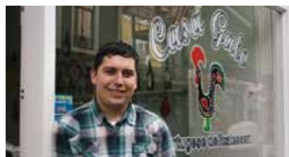
pag 05 > Nieuwe ondernemer: Casa Galo

de druk op de parkeerplaatsen zag Van Aartsen mogelijkheden hiertegen op te treden. Het uitkopen van de seksexploitanten ging hem echter te ver, en de wens om dit 'met gesloten beurzen' te willen realiseren is irreal, zei Van Aartsen. Voordeel van het strenge gemeentelijke handhavingsbeleid vond hij dat de sector in Den Haag 'vrij schoon' is. Bij misstanden worden 'ramen' gesloten, minimaal voor de duur van zes maanden, soms langer. "Maar de bestemming wijzigt niet. Een andere exploitant kan op dezelfde plek weer verder." Volgens Van Aartsen is er van uitbuiting van vrouwen of minderjarigen nauwelijks sprake. Bij de houders van de 85 vergunningen is bekend dat zij bij overtredingen sancties krijgen opgelegd.