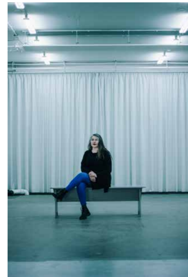
Het afscheid op vrijdag 4 december begint om 14 uur en duurt tot middernacht. Meer info: www.gemak.org