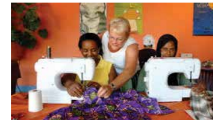
Naailes, elke maandag en dinsdag in De Sprong.

Kinderen van 2 tot 11 jaar spelen vanaf 13.30 uur mee als schaap of herder. De viering met daarin het kerstspel is van 15.30 tot 16.15.