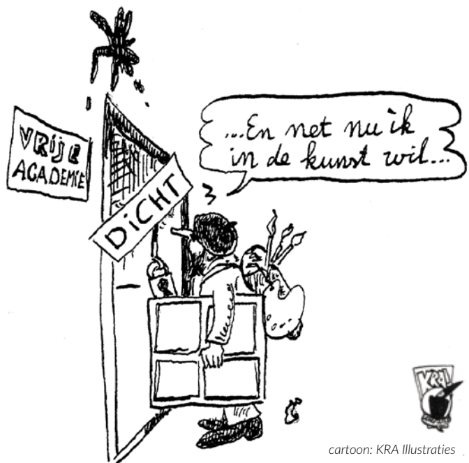
cartoon: KRA Illustraties

Beste buurtbewoners, Dank voor al uw schriftelijke en mondelinge reacties. Het is fijn om te merken dat het magazine zo goed gelezen wordt. Er gebeurt zoveel in de buurt dat we uit alle onderwerpen moeten kiezen. We worden graag geïnformeerd door u als ondernemer en bewoner: redactieoudecentrum@gmail.com