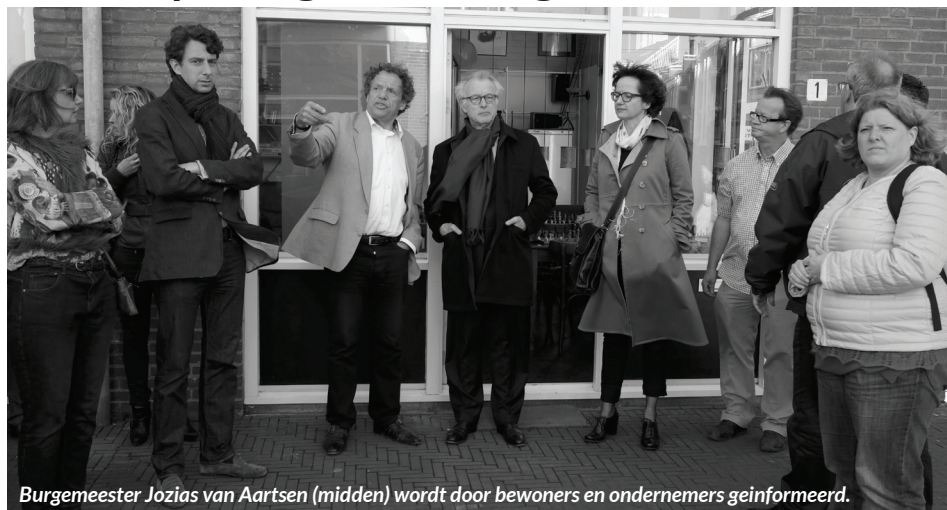
Burgemeester Jozias van Aartsen (midden) wordt door bewoners en ondernemers geïnformeerd.