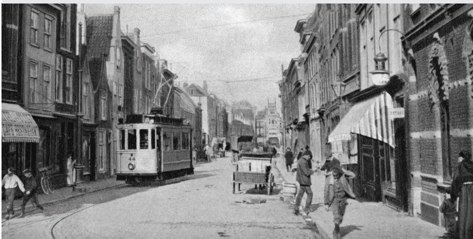
Gedempte Gracht rond 1906. In de verte ligt het Spui, de tram komt aanrijden die de Wagenstraat ingaat.

Deze situatie heeft geduurd tot ca 1926, toen na de sloop van veel woningen de Grote Marktstraat werd gerealiseerd en de tramroutes werden verplaatst naar de randen van onze buurt: Spui en Grote Marktstraat/Prinsegracht.