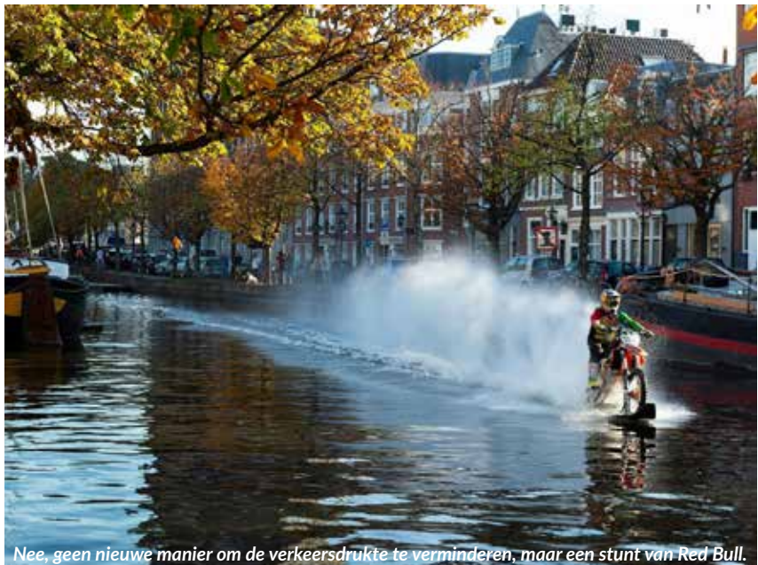
Nee, geen nieuwe manier om de verkeersdruk te verminderen, maar een stunt van Red Bull.

restafvalbak is idealiter niet langer dan 75 meter. Voor verschillende bewoners aan de Prinsegracht, Boekhorststraat, Lange Beestenmarkt, Van Hogelandestraat en het Buitenom is de loopafstand echter langer dan 125 meter. Dit vanwege de bereikbaarheid voor de vrachtwagen die de containers twee keer per week komt legen. Volgens de gemeente kunnen bewoners vaker lopen met lichte zakjes, want de orac's zijn altijd open.