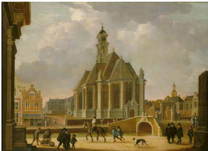
Bartholomeus van Bassen: De Nieuwe Kerk aan het Spui gezien vanuit het oosten, 1650. Haags Historisch Museum

Bronnen: "De Nieuwe Kerk in 's-Gravenhage", 1976 en "Uit Padmoes verzezen; De Nieuwe Kerk in Den Haag", februari 2010