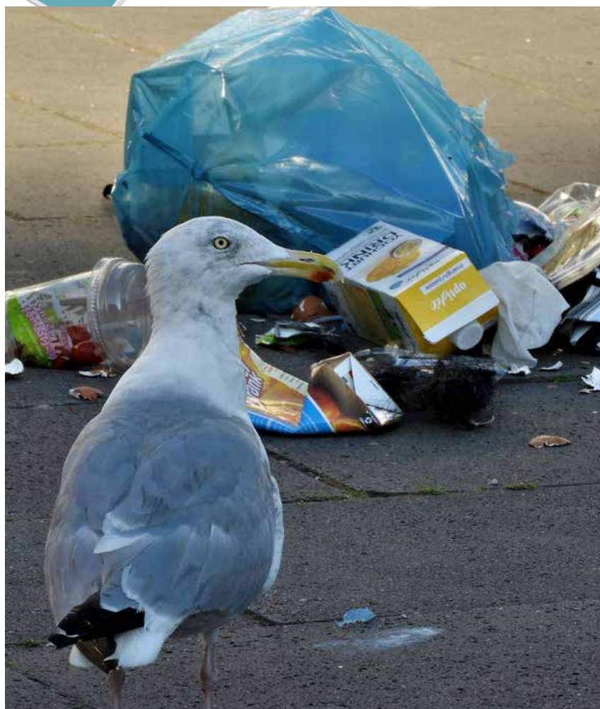
Aan het wekelijkse 'meeuwenbuffet' gaat een einde komen