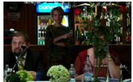
Docu: Nemoc tretej moci