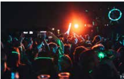
Cuisine de Fous

Tijdens het tweedaagse Iron Sky Film Festival zie je films van Tsjechische en Slowaakse documentairemakers. Zij tonen de moeizame democratische ontwikkeling in hun land na de val van het IJzeren Gordijn en de uitdagingen waar beide landen voor staan. Na afloop van de films kan je in gesprek met experts.