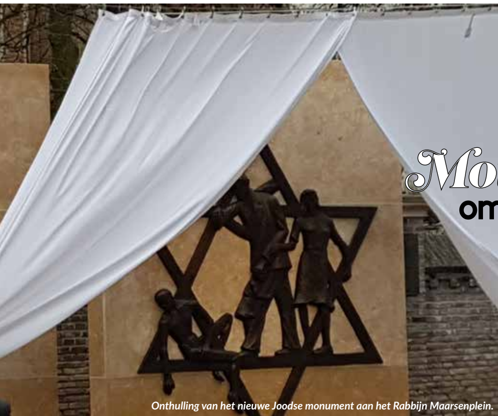
Onthulling van het nieuwe Joodse monument aan het Rabbijn Maarsenplein.