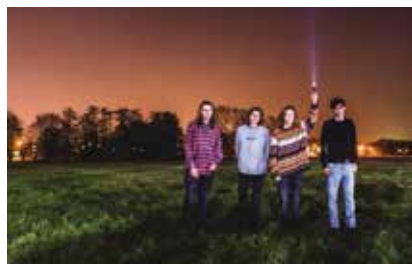
Mantra bij Paardcafé

Vijf sprekers uit de kunst, wetenschap, defensie en politiek buigen zich over de relatie tussen klimaatverandering en conflict. Samen met het publiek vormen zij de Alternatieve Veiligheidsraad. Let op: dit programma vindt plaats in Theater aan het Spui. Voertaal is Nederlands.