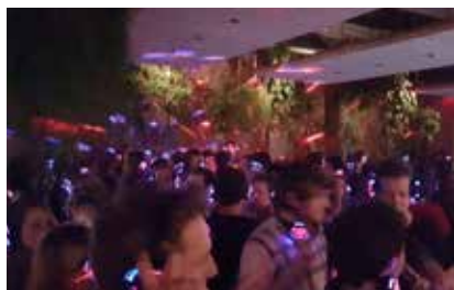
Stille disco bij Bleyenbergh

Begin juni kleurt het prachtige Bleyenbergh weer rood, groen & blauw! Kom lekker dansen op de klassiekers en hitjes van toen of draai je heupen op de disco, hiphop & Afrikaanse tunes van nu. 1 koptelefoon, 3 kanalen. Entree € 10, vanaf 18 jaar.