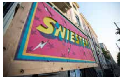
Sniester op diverse locaties

rawk'n'roll retraite in het holst van Den Haag. Op zo'n 15 podia in het Popdistrict zie je meer dan 80 acts; van fragiel tot snoeihard, van bekend tot splinternieuw. Sniester is bepaald niet voor pussies. Wél voor katers.