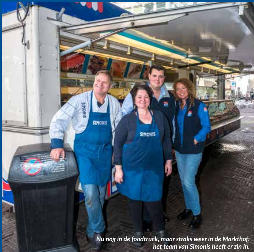
Nu nog in de foodtruck, maar straks weer in de Markthof: het team van Simonis heeft er zin in.

Noorduijn is enthousiast over de plannen van haar buurmeisje. Ze ziet zelfs nog een extra kans: "In Duitsland bestaan gecombineerde ontmoetingsplekken voor jong en oud", weet Noorduijn. "Je kunt de eenzaamheid tegengaan door ook ouderen in dat leercafé welkom te heten. Ouderen die nog goed van geest zijn kunnen die jongeren daar prima helpen. Ik denk maar aan een wiskundeleraar die zijn kennis overdraagt."