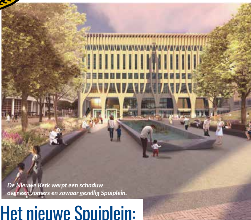
De Nieuwe Kerk werpt een schaduw over een zomers en zowaar gezellig Spuiplein.

mei 2021 — gratis — oplage 4600 — 42e jaargang