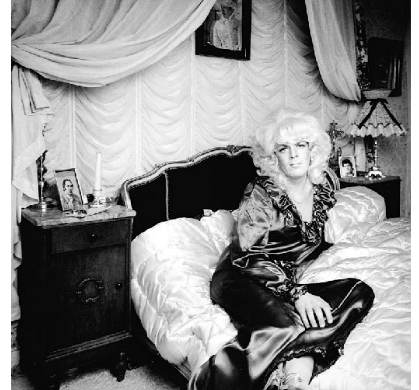
Jonge man in Dolly Parton-kostuum, Den Haag, 1982.