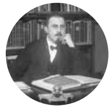
Het Rabbijn Maarsenplein pagina 6-7