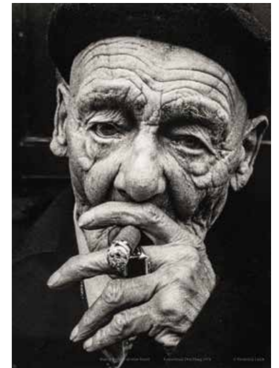
Buurtbewoner in onze buurt Kranestraat, Den Haag, 1974.