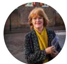
Ode aan de bezorgers pagina 14-15