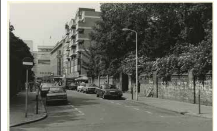
De Bezemstraat in 1980, foto door P.G. Kempff