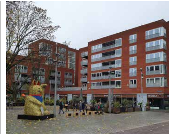
Het huidige Rabbin Maarsenplein, met op de achtergrond het wooncomplex De Parnassijn.