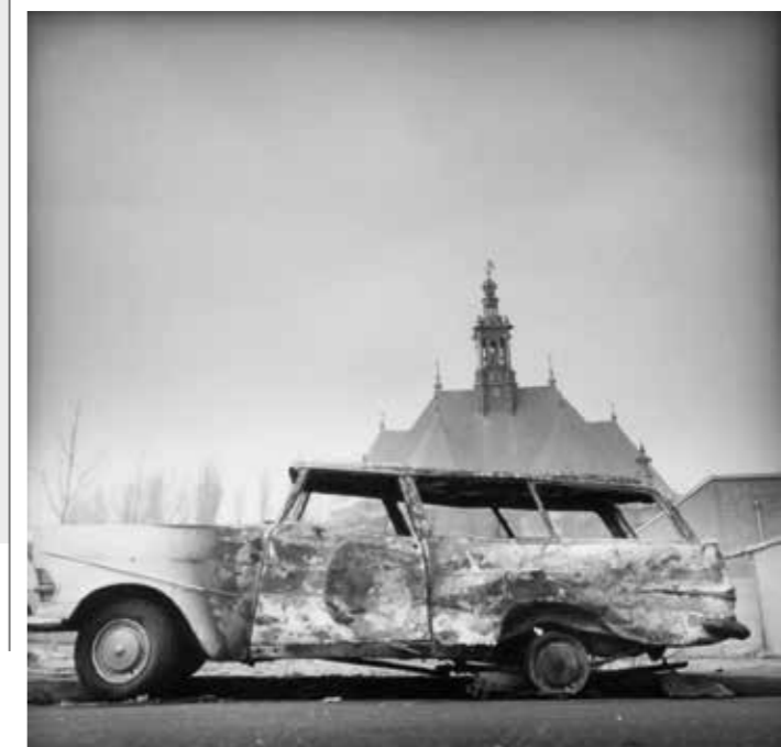
Auto's na de oudejaarsviering, 1973.