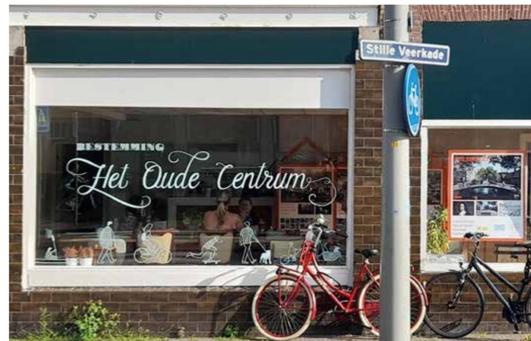
Hoofdkwartier van de wijkorganisatie op Paviljoensgracht 56.