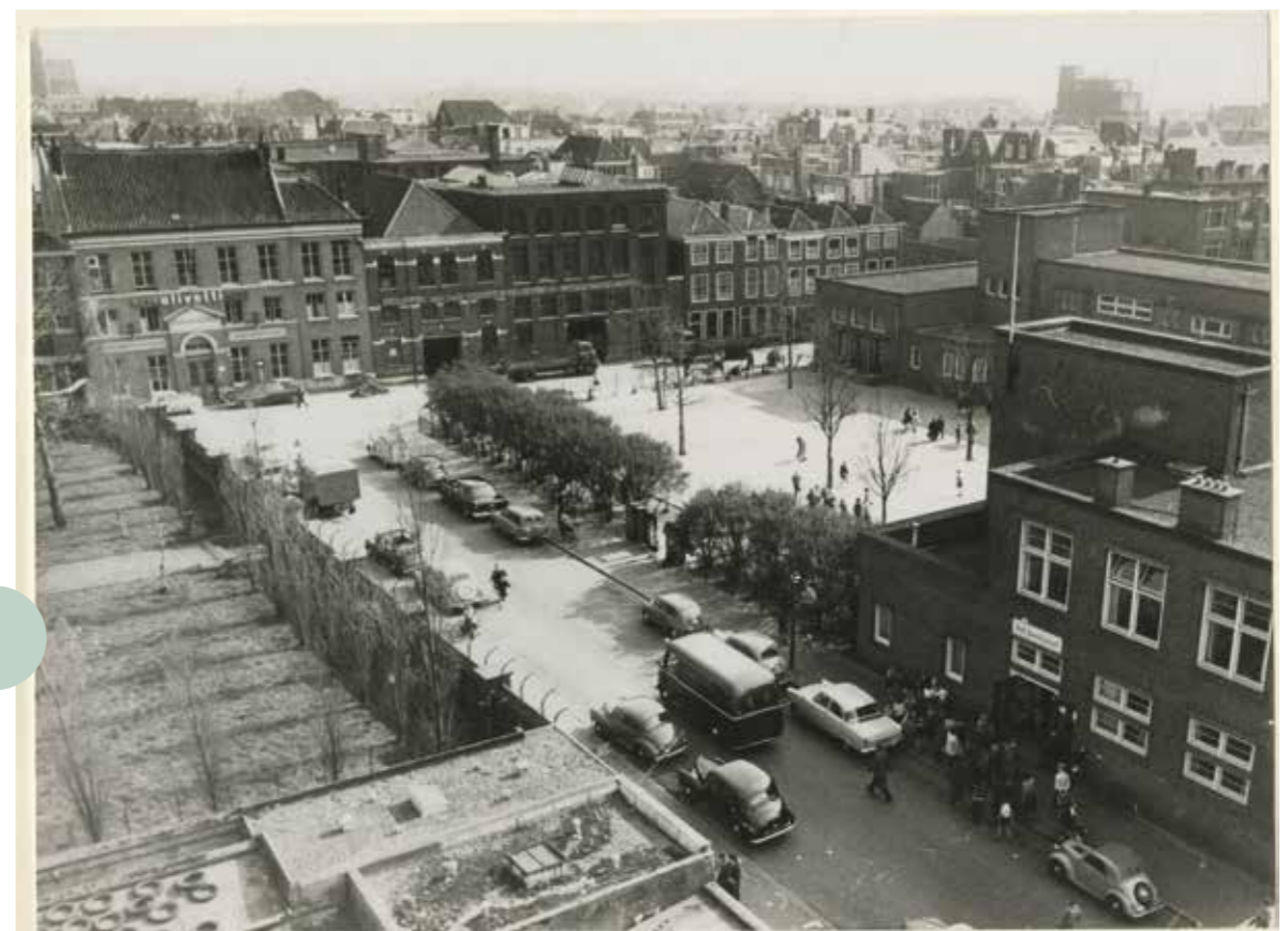
Het Bezemplein in 1957 met links de tuin van de Nieuwe Kerk