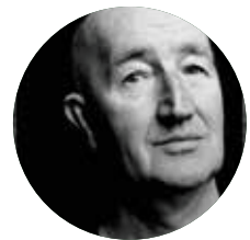
pagina 10-11