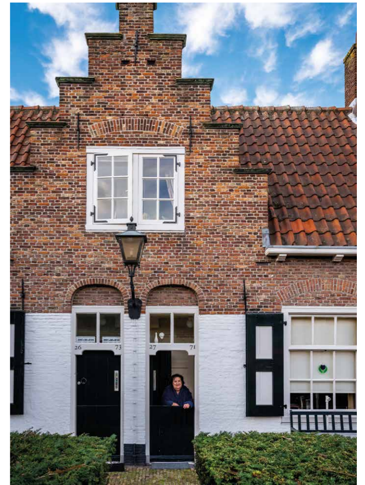
Bronnen: Het Heilige Geesthofje te 's-Gravenhage; behoud voor volgende generaties door onderhoud en renovatie; D.M. Douwes Dekker en W.M. van der Klugt, 2000. Vierhonderd jaar Heilige Geesthofje; Henk Looijesteijn, 2016 Link: https://www.hetheiligegeesthofje.nl/historie-hofje

De perenboom in de prachtige hof tuin van het hofje is geplant in 1647 en als oudste juttepeer van Nederland van grote cultuurhistorische waarde. Spinoza heeft hem 350 jaar geleden als jonge perenboom kunnen aanschouwen. ●