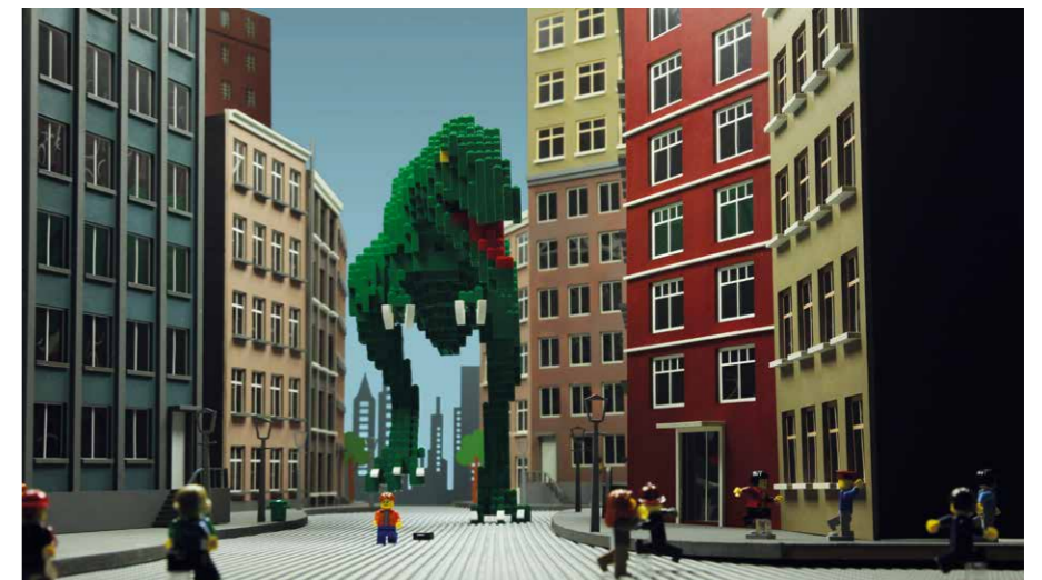
Lego adventure in the city