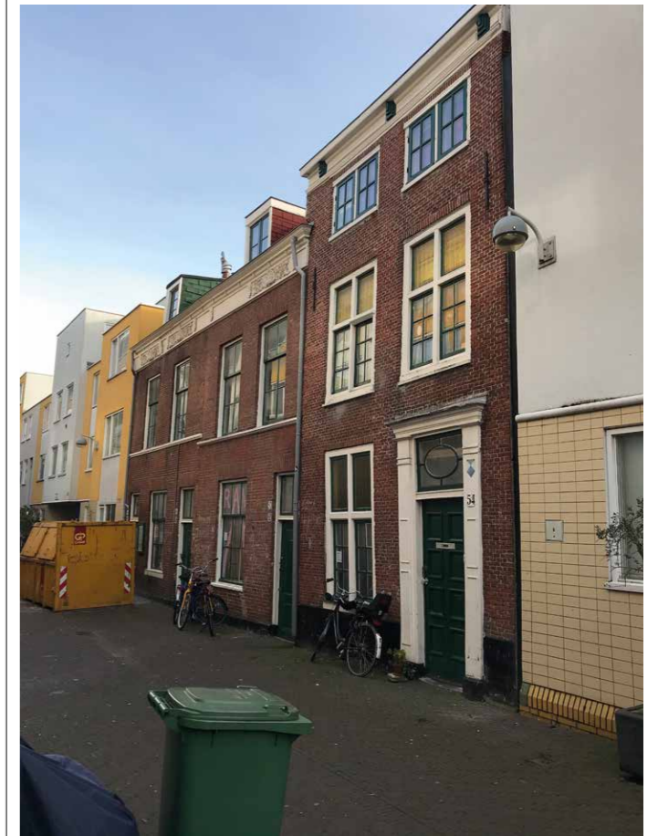
Oog in 't Zeilstraat.