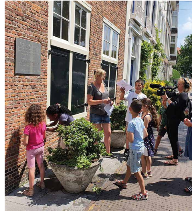
Tijdens het filmen bij het Spinozahuis.