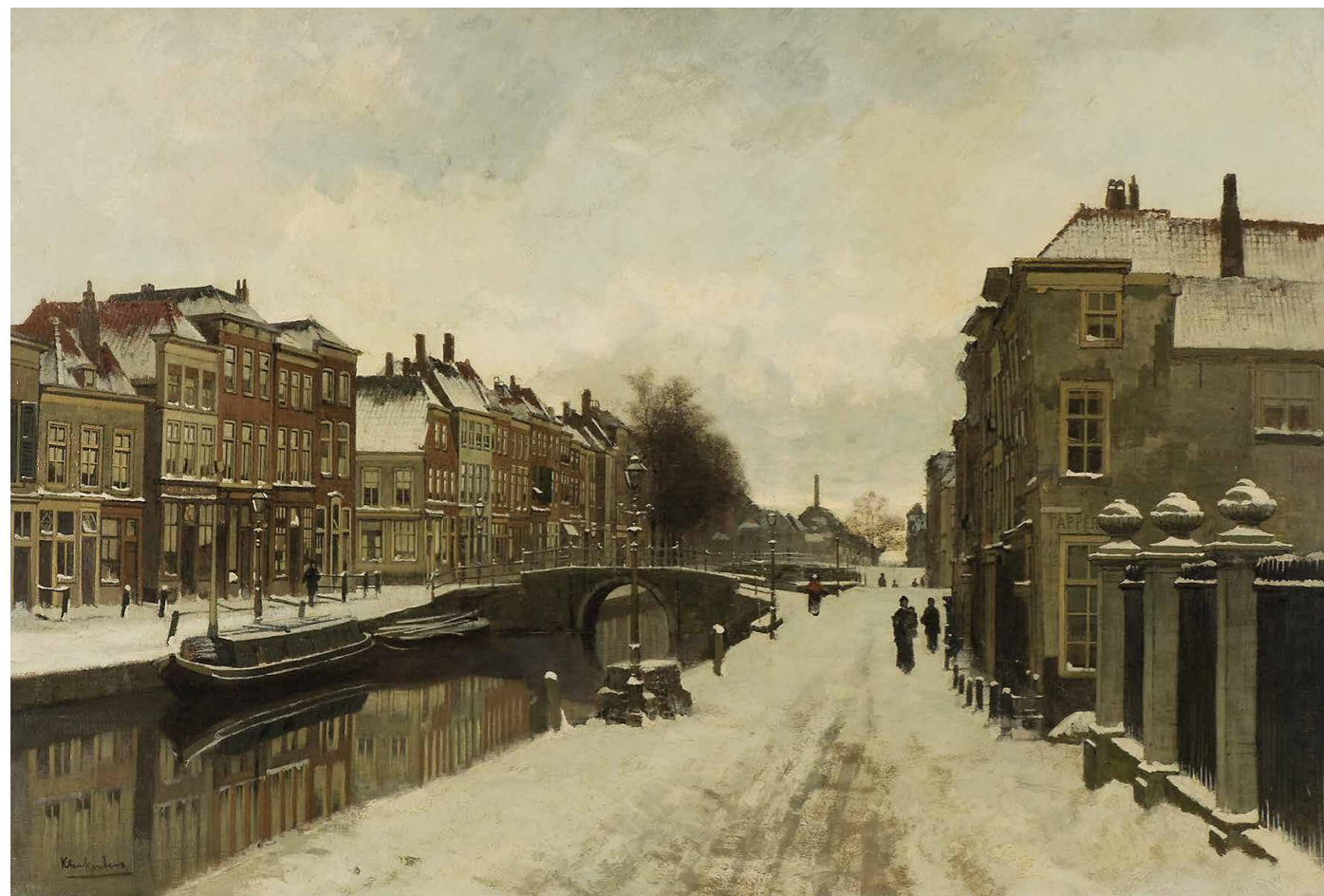
Schilderij J.C.K. Klinkenberg, Het Spui in de winter, ca. 1900 . Collectie Haags Historisch Museum

BOEKHORSTSTRAAT 44A | WWW.NMTAPIJT.NL | 070 - 360 53 69 | INFO@NMTAPIJT.NL