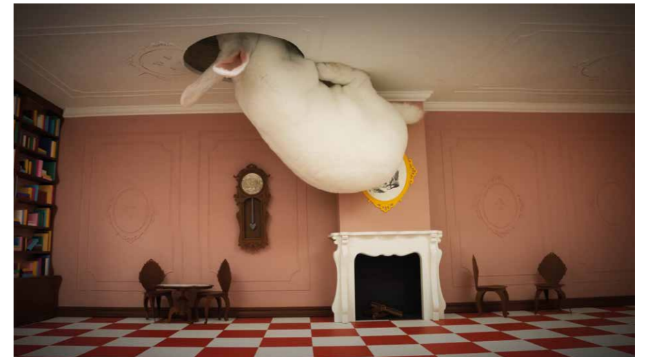
Alice in Wonderland

Je kunt gemakkelijk zelf aan de slag gaan met stop-motion. Veel mensen beginnen met een Lego-poppetje of met klei, maar als je écht wilt onderzoeken hoe stop-motion werkt raad Rogier je aan om met een whiteboard te beginnen.