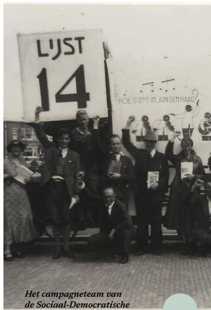
Het campagneteam van de Sociaal-Democratische Arbeiderspartij (SDAP) in mei 1935.