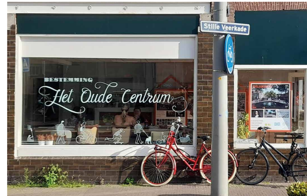
Hoofdkwartier van de wijkorganisatie op Paviljoensgracht 56.