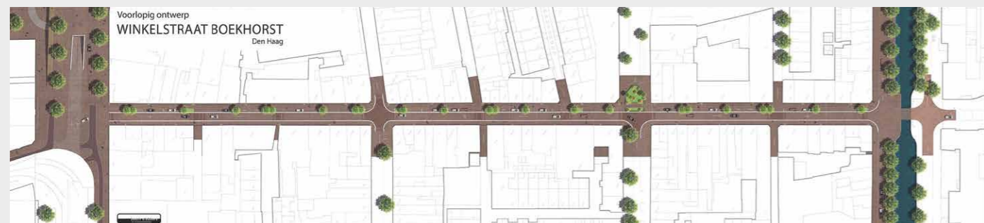
Een van de schetsen van de herinrichting van de Boekhorststraat. Alle bomen, parkeerplaatsen en terrassen komen langs één kant, aan de andere kant wordt een stoep aangehouden.

De herinrichting van de Boekhorststraat wordt weliswaar niet zoals zij zich voorgesteld hadden, maar het hele proces had ook een positief effect: ondernemers, bewoners en vastgoedeigenaren hebben elkaar beter leren kennen. Dat komt in de toekomst ongetwijfeld van pas. ●