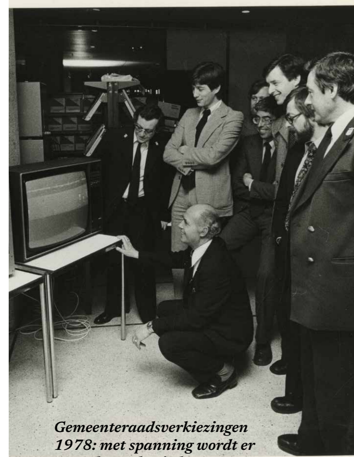
Gemeenteraadsverkiezingen 1978: met spanning wordt er gewacht op de uitslag.

bezorgd, waarin vrijwel alle praktische informatie over de verkiezingen verzameld staat. Meer informatie? Kijk op een van de websites, bel 070-353 44 88 of mail naar verkiezingen@denhaag.nl