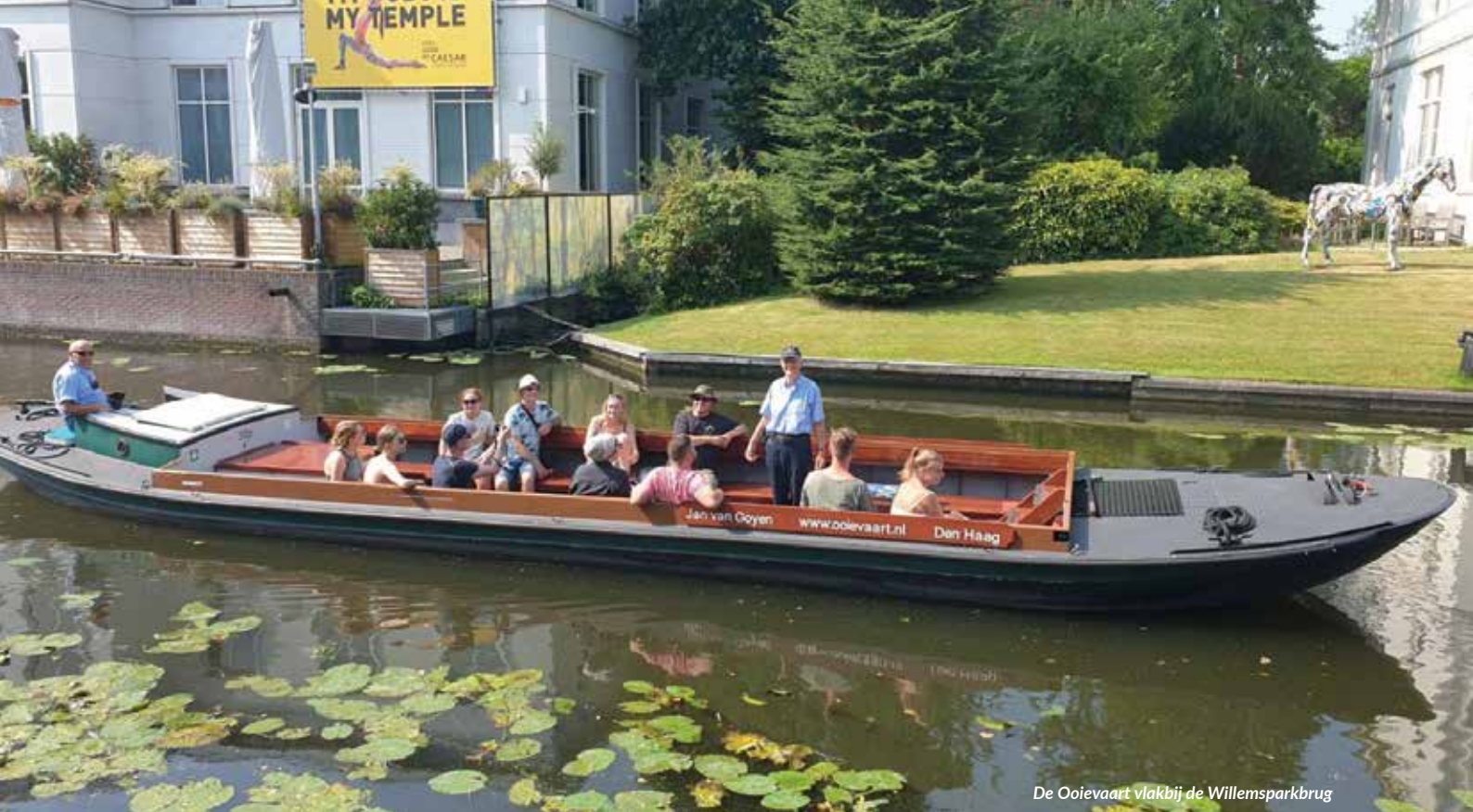
De Ooievaart vlakbij de Willemsparkbrug