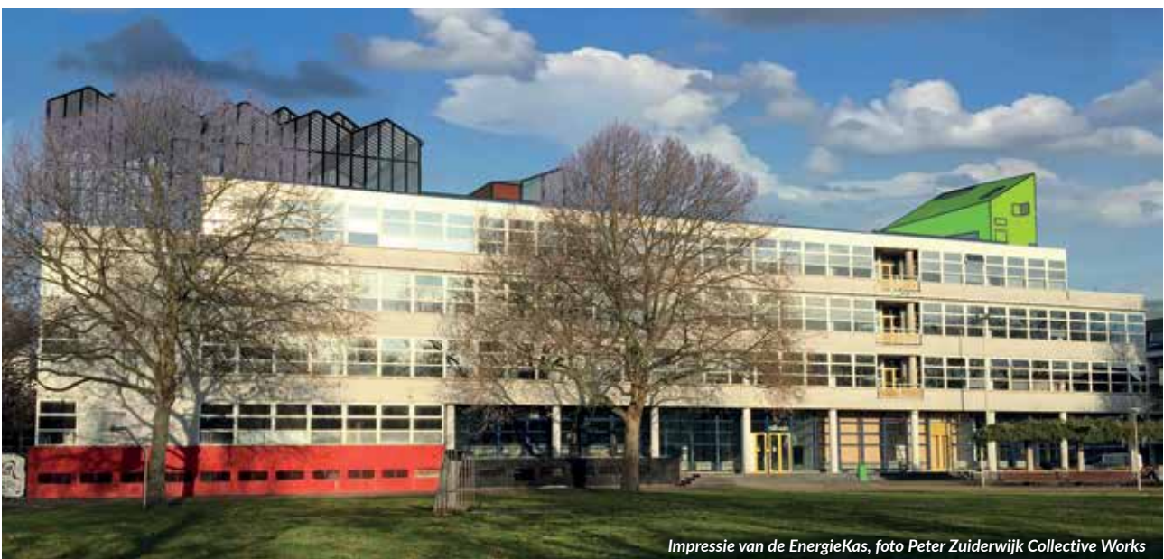
Impressie van de EnergieKas

Tijdens de eerste kennismakingsbijeenkomst op woensdagavond 16 september wordt om 20 uur de film 'Borders in Our Mind' getoond waarin de mogelijkheden voor het op kleine schaal kweken van tropische gewassen in Havana op Cuba centraal staan. De zaal is open vanaf 19.30 uur en de ingang is aan de parkzijde op Helena van Doeverenplantsoen 3. Graag wel van tevoren aanmelden: info@microclimates.nl . De volgende bijeenkomsten vinden plaats op woensdagavond 14 oktober, 11 november, 16 december, 13 januari, 17 februari.