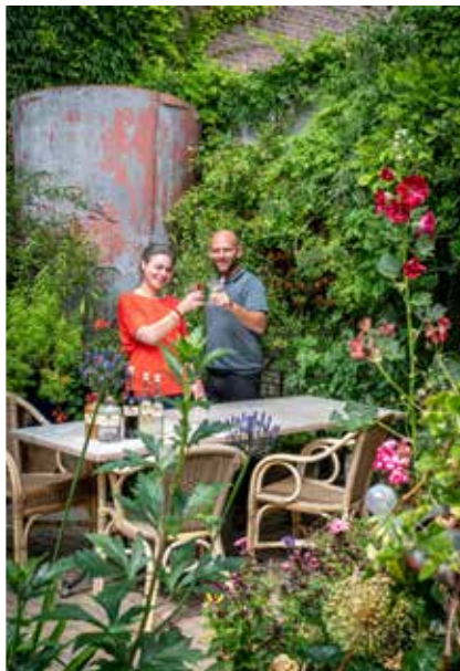
Cocktails en mocktails? Dat kan sinds kort in distilleerderij-museum Van Kleef aan de Lange Beestenmarkt 109. Iedere vrijdagmiddag (tot zes uur) borrelen in de super-romantische museumtuin.