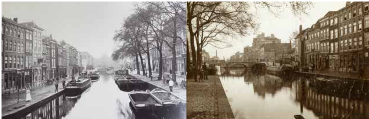
Het Spui ca. 1902, vlak voor de demping. Rechts middenin hotel De Oude Zeven Kerken van Rome.

Aan Spui 271 lag het hotel 'De Zeven Kerken van Rome', dat ooit 'Hotel Pico' heette. In 1872 verbleven de socialistische revolutionairen Karl Marx en Friedrich Engels dat hotel, tijdens het Haagse congres van de Eerste Internationale. Het hotel stond ook bekend om zijn werknemers Hen-