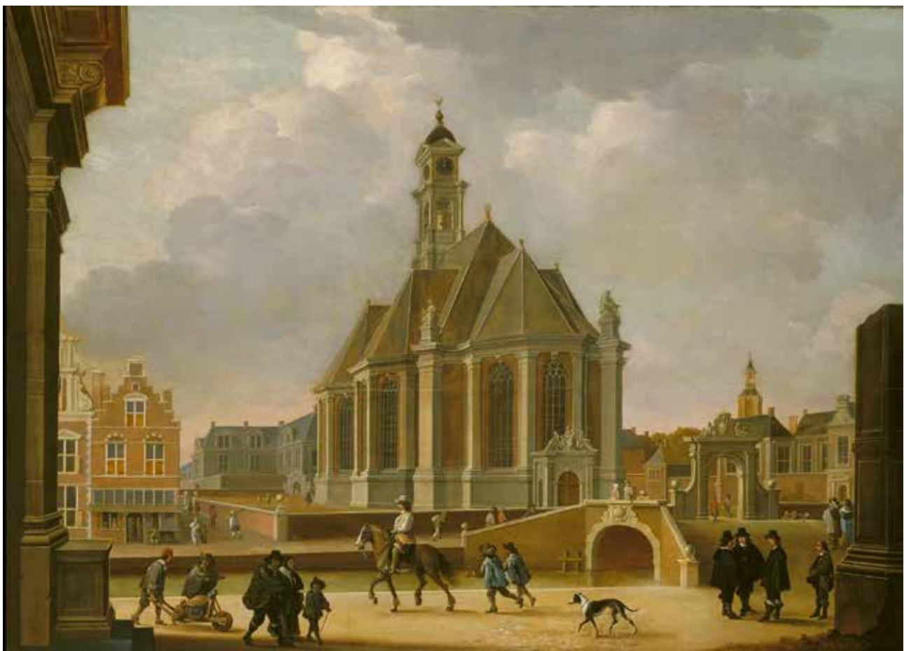
Bartholomeus van Bassen, De Nieuwe Kerk aan het Spui gezien vanuit het oosten, 1650. Collectie Haags Historisch Museum