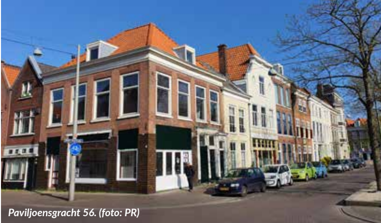
Paviljoensgracht 56.

Bijpraten met de buurtvereniging? Informatie inwinnen over allerlei dingen die er in het Oude Centrum spelen? Tips geven voor interessante verhalen in de Buurkrant? Voor al die dingen en meer zijn wijkbewoners -maar ook mensen van daarbuiten!- elke donderdag welkom op het inlooppreekuur. Aan de Paviljoensgracht 56 is iedereen welkom tussen 16.00 en 19.00 uur. Er wordt ook gezocht naar vrijwilligers die mee willen denken over plannen in de wijk of mensen die zelf ideeën hebben en daar mede-enthousiastelingen voor zoeken.