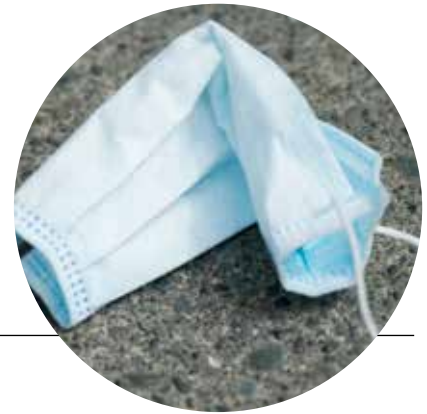
Een triest en helaas maar al te gewoon straatbeeld, ook in het Oude Centrum.

Kijk voor meer informatie op www.afvalscheidingswijzer.nl