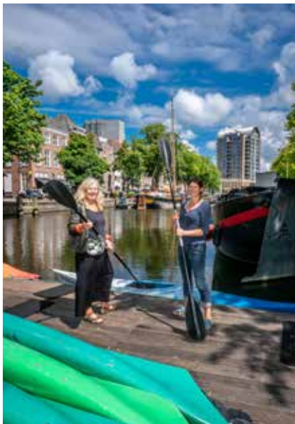
Kanovaren? Daarvoor hoef je niet naar Twente. Opstappen op Groenewegje 144 bij de Wagenbrug kan ook.

De zomer van 2020 was voor de meesten van ons de zomer van het Grote Thuisblijven. Toerist zijn in eigen wijk, kan dat wel? Nou, als je in een mooie en dynamische wijk als het Oude Centrum woont wel! Fotograaf Kees Oosterholt geeft een mooie impressie.