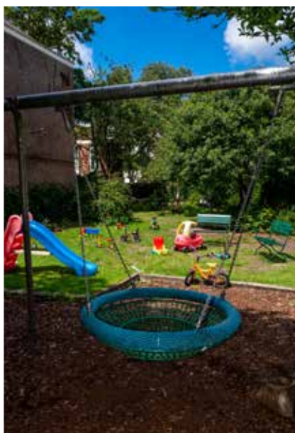
Buurtparkje Wagenstraat. Een verrassend, groen stadsparkje compleet met alle denkbare kinderspeelgoed, en met hamsters. Bereikbaar via het steegje bij Wagenstraat nummer 149.