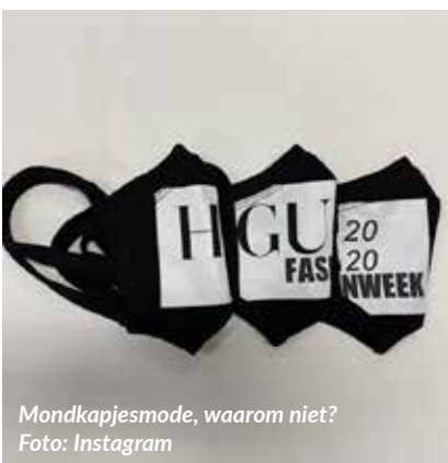
Mondkapjesmode, waarom niet?