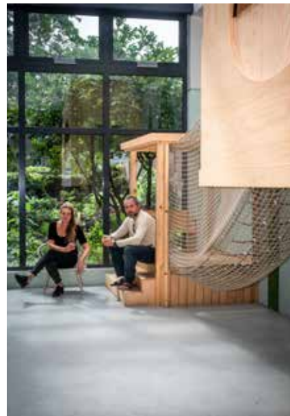
Kinderen kunnen zich uitleven bij de Boomhuttenclub in de Boekhorststraat. In het weekend kun je er s'avonds blijven eten.