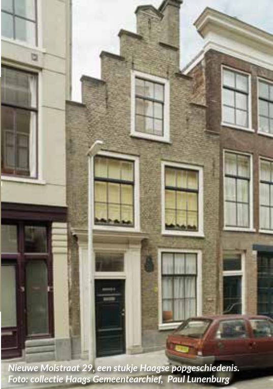
Nieuwe Molstraat 29, een stukje Haagse popgeschiedenis.