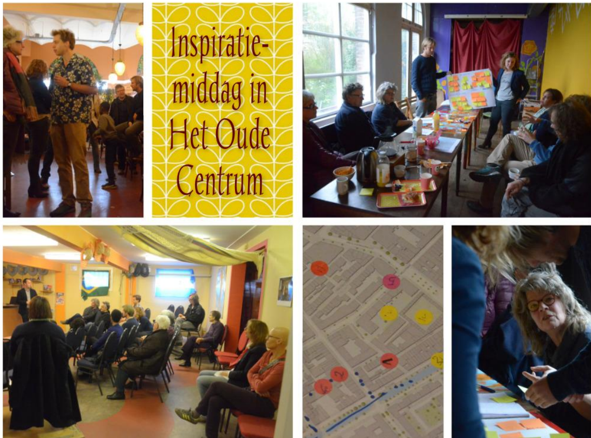
Fotograaf en vormgeving: Marieke de Jong